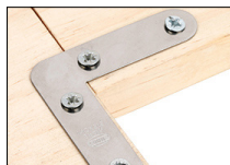
Escuadras planas metálicas