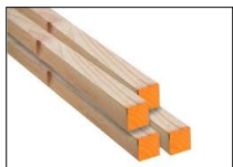
Listón de pino de 1' x 1'