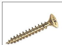
Tornillos auto perforantes