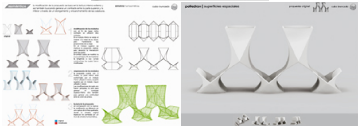
Estudiantes: Misrahi y Lamura - Curso 2015